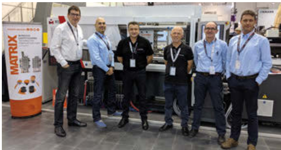
La tecnologia de Matrix presentada a la fira K de Düsseldorf en col·laboració amb Milacron

subministrament mèdic. Per això, en els darrers anys, Matrix ha ampliat la cartera de clients del sector mèdic i farmacèutic. Els requisits de qualitat dels productes emmotllats (consumibles d'anàlisi, cànules, dosificadors, aparells quirúrgics...) són elevats i pocs són els fabricants de motlles a Europa que puguin assolir aquests estàndards.